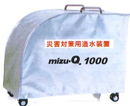
災害時でも安心な防炎カバー付